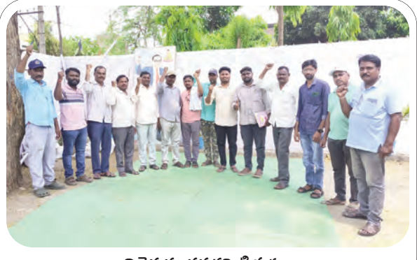
ఎన్నికైన నూతన కమిటీ సభ్యులు