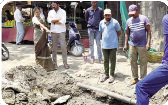
రహదారిని అందువల్ల ట్రాఫిక్కు అంతరాయం కలగకుండా సిబ్బంది, ఇంజనీరింగ్ అధికారులు పాల్గొన్నారు.

తగిన జాగ్రత్తలు తీసుకోవాలని ఆదేశించారు. అవసరమైతే హెచ్చరిక బోర్డులు, బ్యారికేడ్లు ఏర్పాటు చేసి ప్రజలకు ముందస్తు సమాచారం అందించాలని సూచించారు. అదేవిధంగా పనులను ఆలస్యం చేయకుండా వేగవంతంగా పూర్తి చేసి, తవ్విన ప్రాంతాన్ని సరిగా మట్టి పూడ్చి రహదారిని యథావిధిగా పునరుద్ధరించాలని చెప్పారు. పనులు పూర్తైన అనంతరం రహదారి స్థితిని పరిశీలించి అవసరమైన మరమ్మతులు చేయాలని, ప్రజలకు ఎలాంటి అసౌకర్యం కలగకుండా చూడాలని అధికారులకు స్పష్టం చేశారు. స్థానిక ప్రజలు ఎదుర్కొంటున్న సమస్యలను దృష్టిలో ఉంచుకుని, ఇలాంటి అత్యవసర పనులను ప్రాధాన్యతగా తీసుకుని త్వరితగతిన పరిష్కరించాల్సిన బాధ్యత అధికారులపై ఉందని ఆమె పేర్కొన్నారు. ఈ కార్యక్రమంలో మున్సిపల్